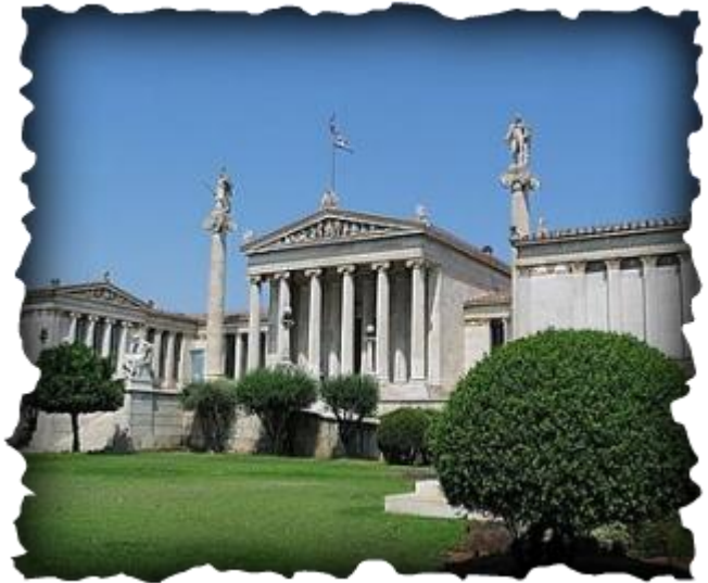
Εθνικό Μετσόβειο Πολυτεχνείο

Οι άνθρωποι αυτοί πάντα είναι πολύ λίγοι. Είναι όμως μια θαυμαστή μαγιά. Στη σημερινή κοινωνία της παντοδύναμης τεχνοκρατίας, του οικονομικού αδυσώπητου ανταγωνισμού και της καταναλωτικής απληστίας δεν ευνοείται η εμφάνιση ανθρώπων αφοσιωμένων σε αγαθοεργίες. Πλήττεται κάθε ιδέα κοινωνικού χρέους και προσφοράς προς την πατρίδα.