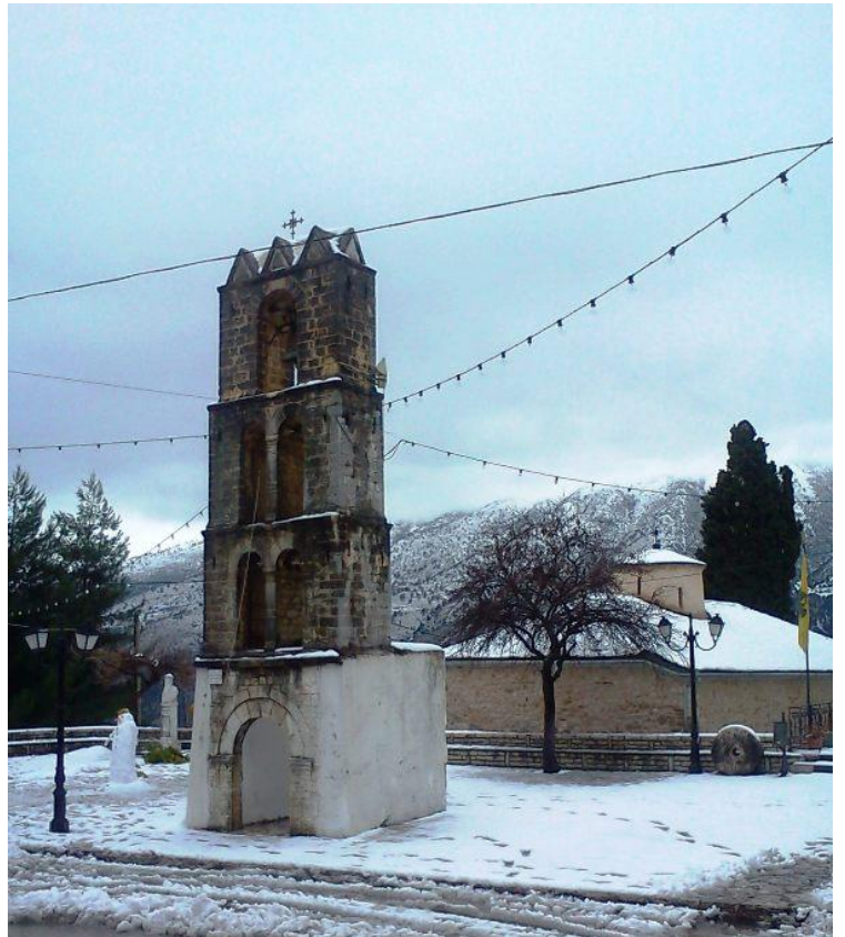
Το καμπαναριό της εκκλησίας της Αγίας Τριάδας – Φανερωμένης που δεσπόζει στην πλατεία του χωριού.