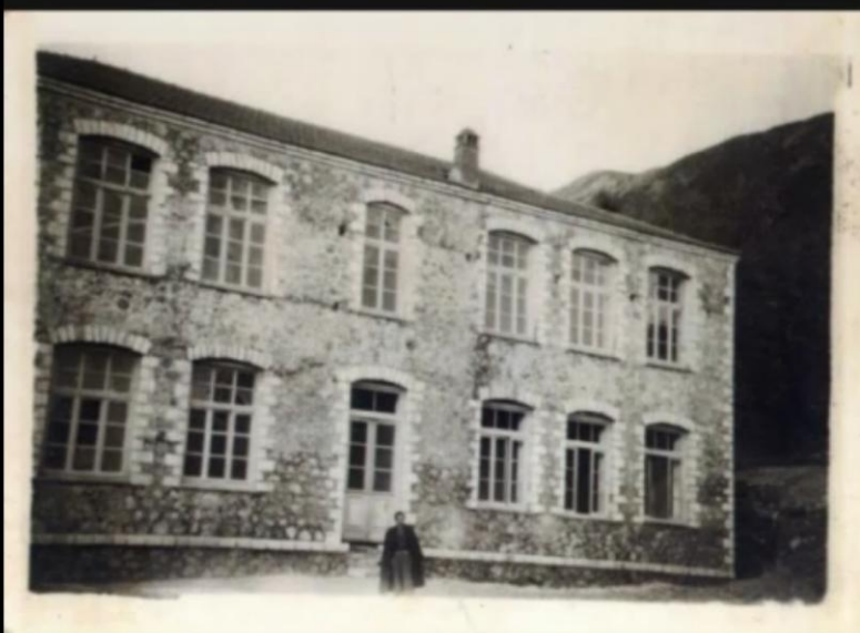
Παλιά φωτογραφία του Δημοτικού σχολείου των Παπαδατών ( 1963 – 1964 )