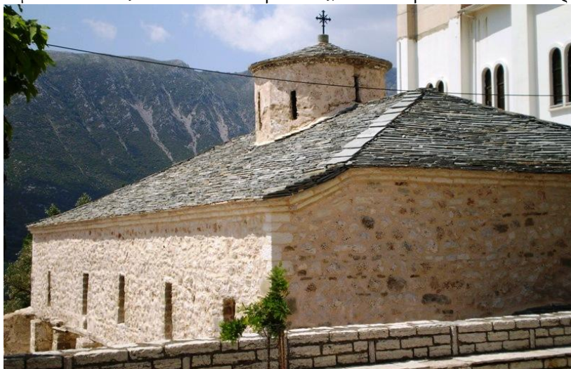
Η Εκκλησία ανακαινισμένη

στο σπίτι να κοιμηθούμε και αύριο που θα φέξει ο Θεός την ημέρα θα το συζητήσουμε αυτό. Την άλλη μέρα ο πεθερός της πήγε στην εκκλησιαστική επιτροπή και τους είπε τι ακριβώς συνέβη στο σπίτι του με τη νύφη του. Έτσι ομόφωνα όλοι οι κάτοικοι του χωριού δέχτηκαν και έχτισαν την εκκλησία στο σημείο που είχε δει η νύφη τα τρία καντήλια. Και η εκκλησία πήρε το όνομα ΑΓΙΑ ΤΡΙΑΔΑ (τρία καντήλια) Η ΦΑΝΕΡΩΜΕΝΗ ( που το φανέρωσε μόνη της).