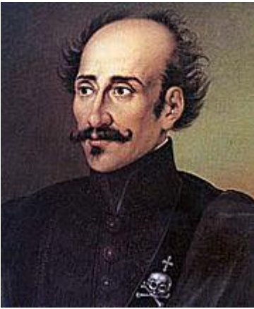
Αλέξανδρος Υψηλάντης με το έμβλημα του Ιερού Λόχου. Εθνικό Ιστορικό Μουσείο, Αθήνα

Το 1818 η έδρα της Φιλικής μεταφέρθηκε από την Οδησό στην Κωνσταντινούπολη, δηλαδή στην καρδιά της Οθωμανικής εξουσίας, κάτι που πιστοποιούσε «την αυτοπεποίθηση των Φιλικών στις συνομοτικές οργανωτικές τους ικανότητες» 71 ενώ ο θάνατος του Σκουφά ήταν σοβαρή απώλεια. Με αφορμή αυτό το γεγονός και με δεδομένη τη ραγδαία εξάπλωσή της, οι υπόλοιποι από τους ιδρυτές επιχείρησαν να βρουν μια μεγάλη προσωπικότητα να αναλάβει τα ηνία, θέλοντας να της προσδώσουν μεγαλύτερο κύρος και αίγλη. Στις αρχές του 1818 έγινε μια συνάντηση με τον Ιωάννη Καποδίστρια ο οποίος όχι μόνον αρνήθηκε, αλλά αργότερα έγραψε πως θεωρούσε ότι οι Φιλικοί ήταν υπαίτιοι για τον όλεθρο που προμηνυόταν στην Ελλάδα. Τελικά, μετά από αρκετές επαφές, τον Απρίλιο του 1820 ανέλαβε την αρχηγία της Φιλικής Εταιρείας ο Αλέξανδρος Υψηλάντης.