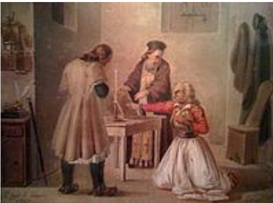
Ο όρκος, ελαιογραφία του Δ. Τσόκου (1849).

Οι Ιερείς ήταν επιφορτισμένοι με το έργο της μύησης στους δύο πρώτους βαθμούς. Όταν ο Ιερέας πλησίαζε κάποιον, σιγουρευόταν για τη φιλοπατρία του και τον κατηχούσε πλάγια στους σκοπούς της εταιρείας, οπότε το τελευταίο στάδιο ήταν να ορκιστεί.